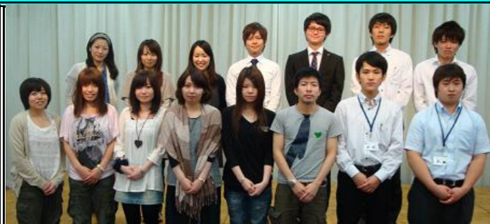
トキハとトキハインダストリーの新入組合員のみなさん

6月12日から13日にかけてセントレジャー城島高原ホテルで2011年新入社員組合員セミナーが行われました。 トキハ労連の新入社員15名が参加。グループに分かれたゲームや全体での交流会を通じてトキハグループの連帯を確認しました。ゲームではコミュニケーションの上で意思疎通の難しさやチームワークの重要性を実感したと思います。さらに九州労金から「賢い消費者になるために」と題してライフプランニング、取りわけ金融機関の賢い利用法を学びました。これからの活躍を期待しています。