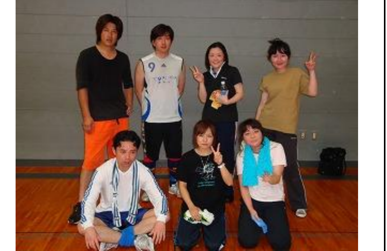
準優勝、あけの1階中心の「チーム SATOMI」のみなさん