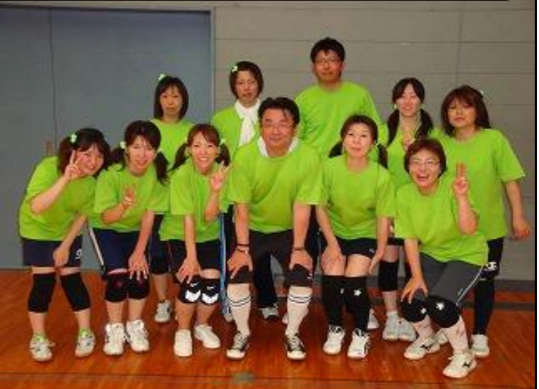
優勝したチーム「BU・HU・WU～」の皆さん、すばらしいチームワークで日ごろの憂さを晴らしていました(笑)

6月29日、13:00より、南大分体育館にてトキハインダストリー労組初のソフトバレーボール大会が行われました。 開始時間が午後ということもあり、当日の会場は、たださえ猛暑の日本列島をさらに暑くするほどの熱気に包まれました。組合側で用意したドリンクだけでは足りず、各チームで用意した冷たいものを取りながら、選手と一緒に流れる汗を拭きながら応援する姿がみられました。 使用コートは1面でしたが、参加した皆さんの協力で予定時間通りにスムーズな進行をすることができました。参加各チームの皆さん、応援にこられたかたがた本当にありがとうございました。 優勝した玖珠店のチーム「BU・HU・WU～」、グリーンユニフォームをそろえての参加に日ごろのチームワークのよさがうかがえ、試合の結果もそのようになったようです。手探り状態の運営で、競技ルールの整理が必要ですが、スタッフを中心に次回以降の開催に向けて来期も取り組んでいきますので、ご期待ください。